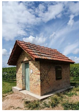
Weinbergs- Haus Nr. 11