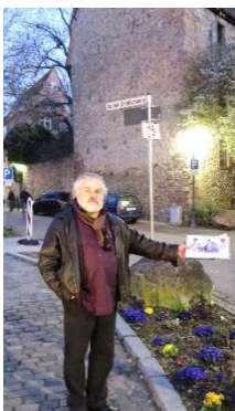
Standortsuche 2015 alte Synagoge