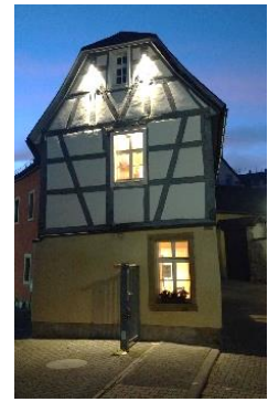
Installation der Illumination am Altstadtthaus