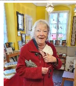
treue Besucherin in der Amtgasse