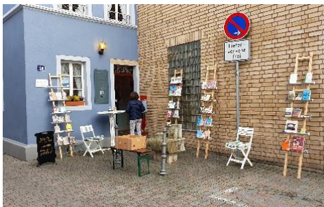
Buchantiquariat in der Amtgasse 14