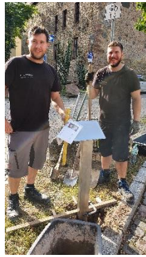
2021 Montage - Schild