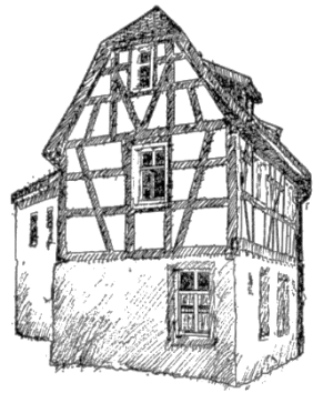
Flonheimer Straße 3 erbaut 1705 renov. 2000-2003

Bericht der Mitgliederversammlung mit Wahlen vom 19.11.2021 im Jobcenter Bleichstraße 6-8