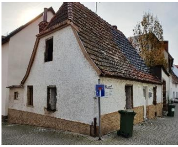
Kleinhaus Flonheimer Straße Nr. 27