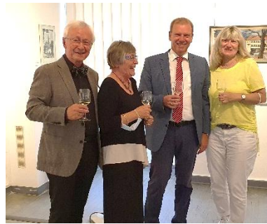
Ausstellungseröffnung „Künstlerblicke auf Alzey aus zwei Jahrhunderten“ im Burggrafiat – mit Bilderspende von Ehepaar Kleinknecht an die Stadt