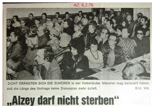
DICHT DRÄNGTEN SICH DIE ZUHÖRER in der Volkerstube. Mancher mag bedauert haben, daß die Länge des Vortrags keine Diskussion mehr zuließ.