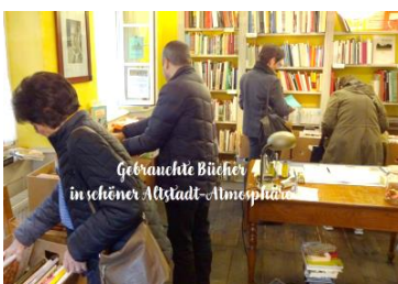
Gebrauchte Bücher in schöner Altstadt-Atmosphäre